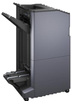
DF-7130 finisher (niet beschikbaar voor 2507ci/3207ci) (4,000 vellen) nieten(100 vellen) perforatie module PH-7C