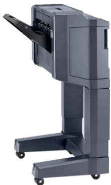
DF-7120 finisher (1,000 vellen) nieten (50 vellen) perforatie module PH-7C