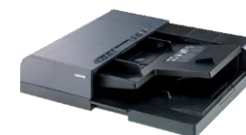
DP-7100 Dubbelzijdige documentfeeder 140 vellen)