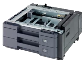
PF-7100 papierlade (2 x 500 vellen)