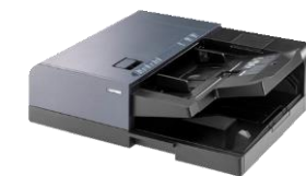
DP-7110 Dubbelzijdige documentfeeder (270 vellen)