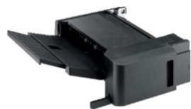
DF-7100 Finisher interne (500 vellen), nieten (50 vellen), perforatie module PH-7120